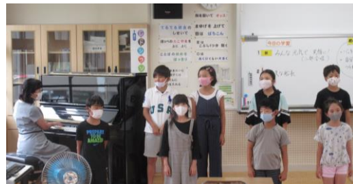
【子供たちの練習風景】

美しい歌声を響かせるためには、安定した気持ちが大切です。落ち着いた学習環境の中で、分かる喜びを感じられる授業に力を注いでいる教職員も『みんな元気で 笑顔に！』引き続き頑張っていきたいと思います。今はまだ苦しいけれど、きっと希望の光が見えてくることを信じて！